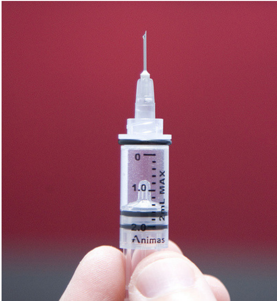
Die Insulinspritze – oft gefährlicher als der Zucker selbst