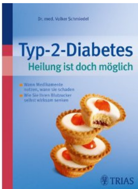
Schmiedel, V.: Typ II Diabetes – Heilung ist doch möglich, TRIAS-Verlag, 2010, 14,95 €