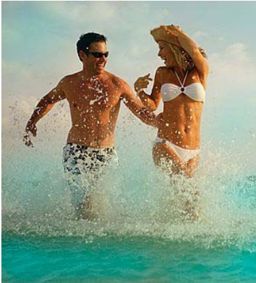
Verliebtheit steigert das Serotonin und schützt vor Depressionen

Diese Vorstufen müssen allerdings erst in Serotonin umgewandelt werden, wozu wir Zink und Vitamin B6 benötigen. Ich bestimme daher bei entsprechendem Verdacht die Vollblut(!)spiegel (Serum ist zu ungenau!) beider Nährstoffe, finde gerade bei Depressiven sehr häufig einen Mangel und substituiere dann diese wichtigen Vitalstoffe .