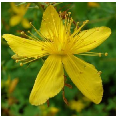
Johanniskraut, Heilpflanze des Lichtes