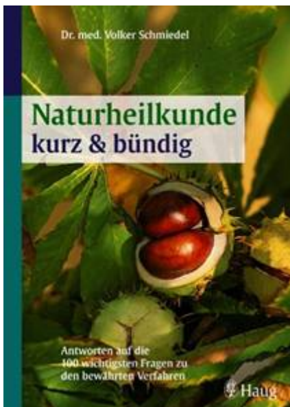
Volker Schmiedel: Naturheilkunde kurz und bündig, 12,95 €

Möchten Sie hingegen mehr über die wichtigsten Naturheilverfahren sowie über die naturheilkundlichen Behandlungsmöglichkeiten erfahren, dann ist folgendes Buch genau das Richtige für Sie: