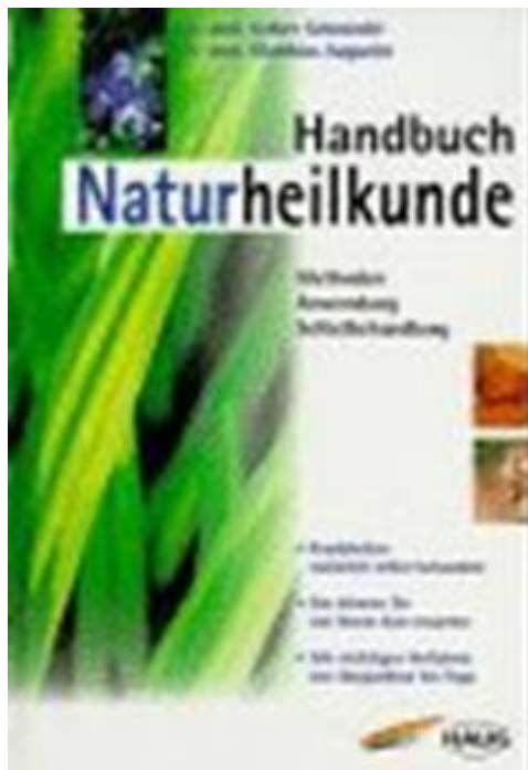
Volker Schmiedel: Handbuch Naturheilkunde, 32,95 €